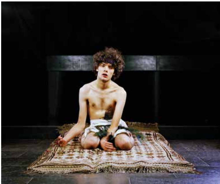
Lukas.SchönerHeit, 2013, Courtesy the artist © Julia Krahn