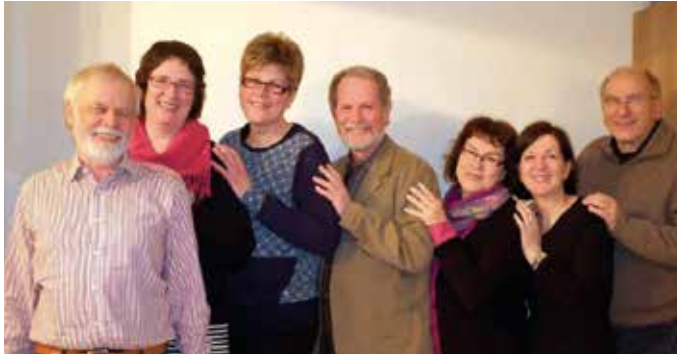
^ Die Schreibverrückten

Im Goethequartier gibt es sehr schöne grüne Plätze. Zu vier dieser Orte lädt die „Leher-Lauben-Lesung“ ein. Dort wird gelesen, erzählt und gespielt. Viele besondere Momente an besonderen Orten! Zum Abschluss sind alle eingeladen, sich zu einem gemütlichen Beisammensein im Wohnprojekt Lehe zu begegnen. Der Eintritt ist frei – Spenden für den „Leher Kultursommer“ sind willkommen.